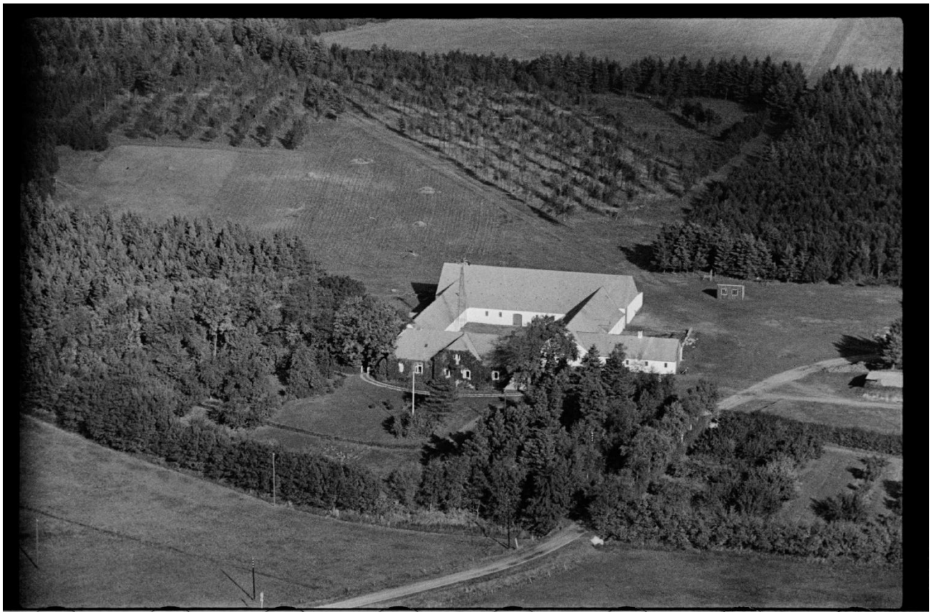
Store Gjedbo 1947.