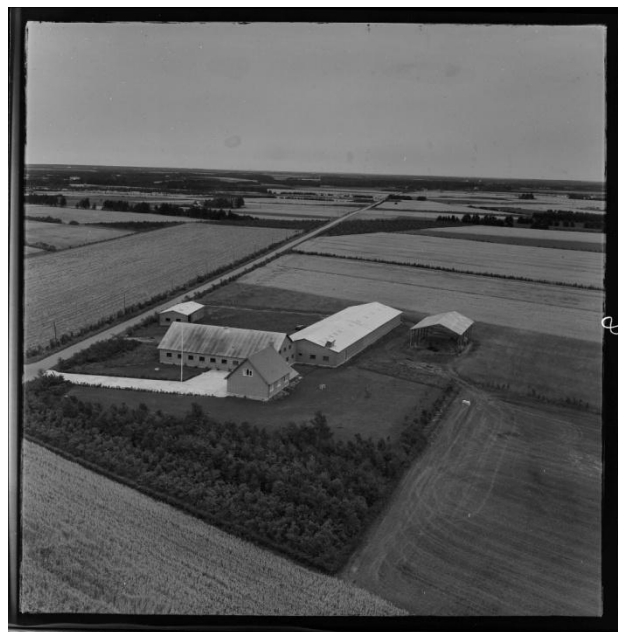
Øster Gjedbo 1965