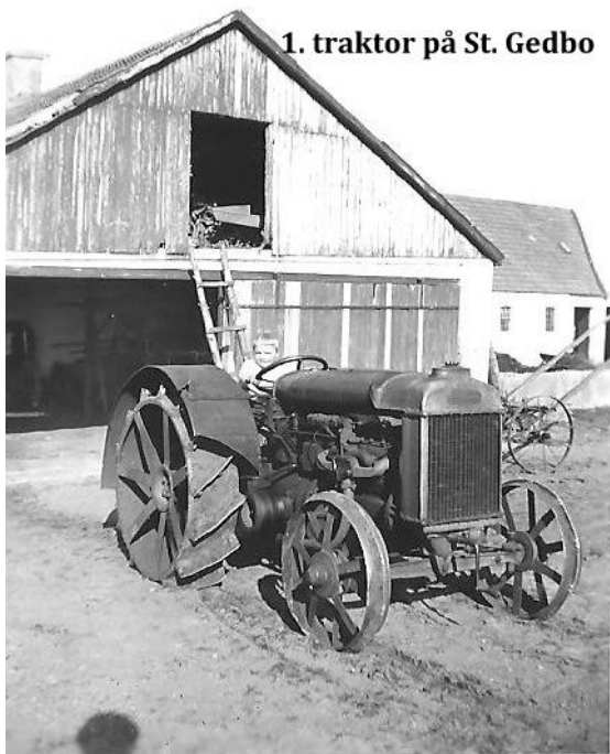
1. traktor på St. Gedbo