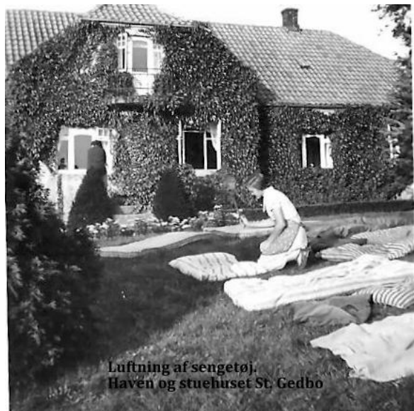
Luftning af sengetøj. Haven og stuehuset St. Gedbo