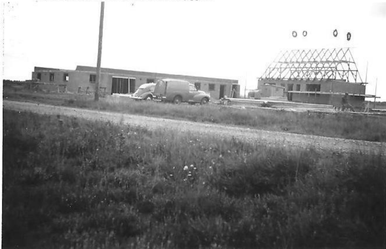
Statsejendommen Øster Gedbo bygges.