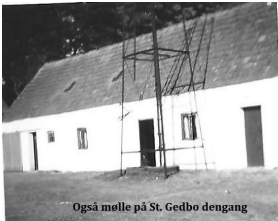
Også mølle på St. Gedbo dengang