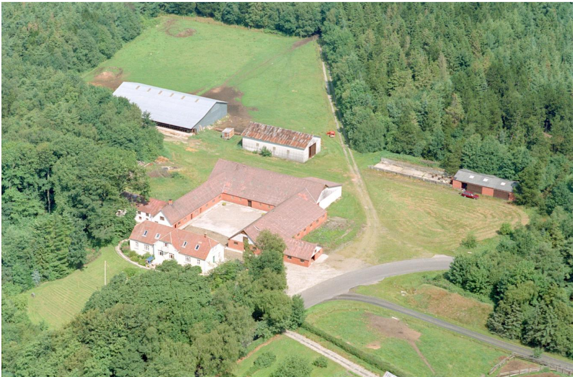
St. Gjedbo 1991.