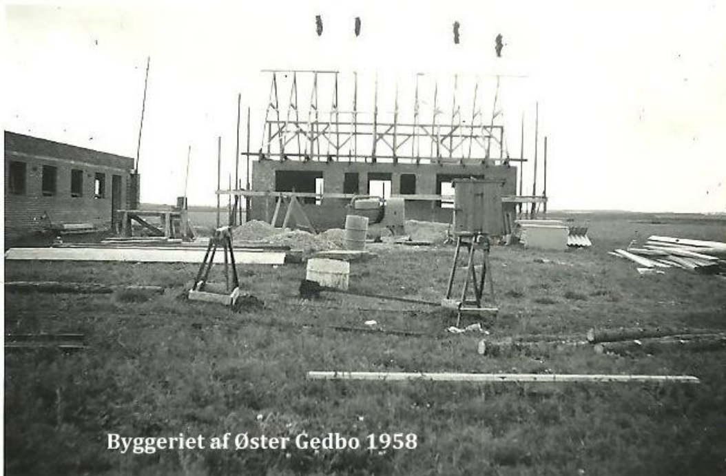
Byggeriet af Øster Gedbo 1958