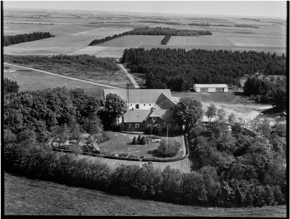
St. Gjedbo 1955 med mølle og stor have.