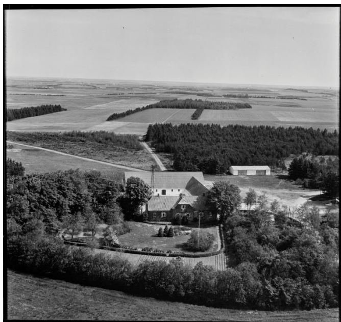
Store Gjedbo 1958