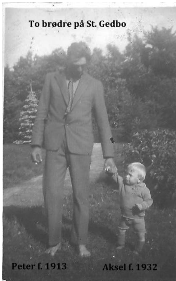
To brødre på St. Gedbo