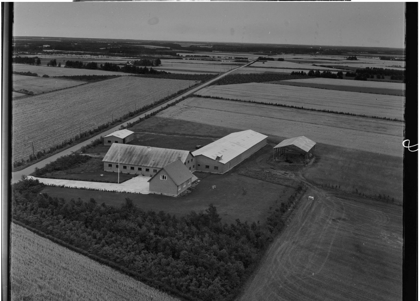
Øster Gjedbo 1965