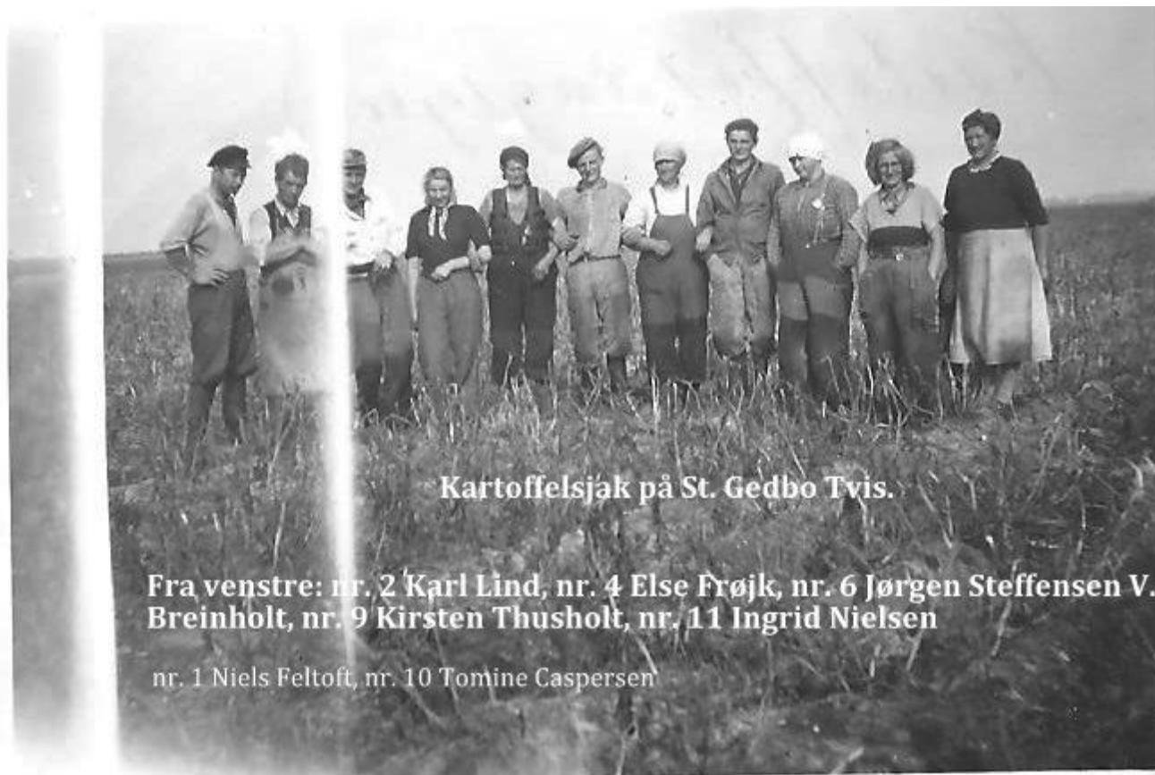
Kartoffelsjak på St. Gedbo Tvis.