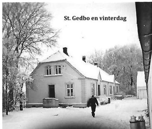
St. Gedbo en vinterdag