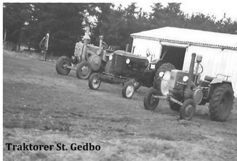
Traktorer St. Gedbo