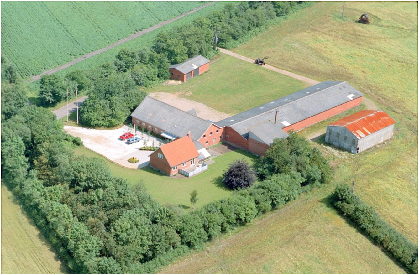
Øster Gjedbo 1991