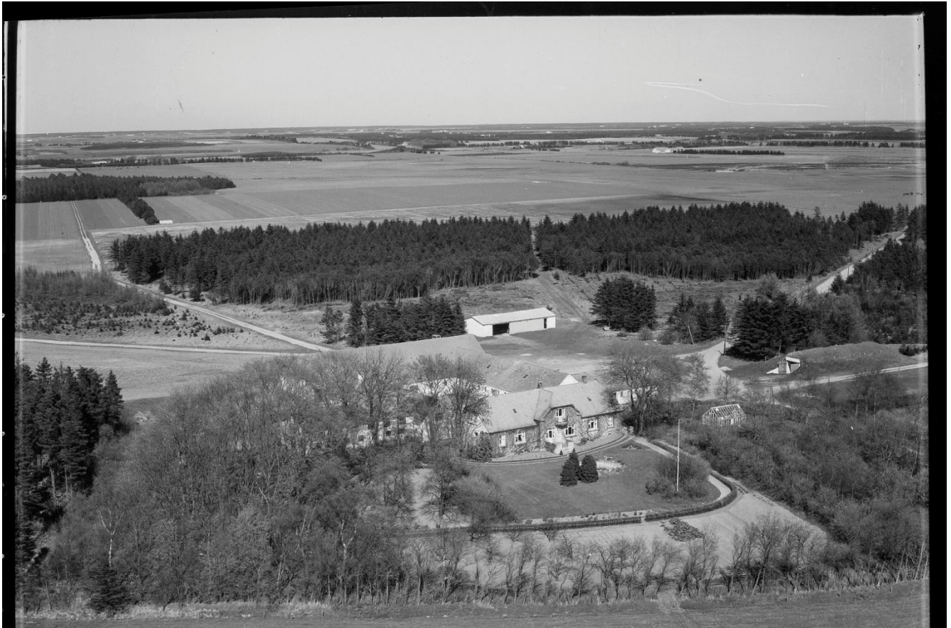
Store Gjedbo 1958.