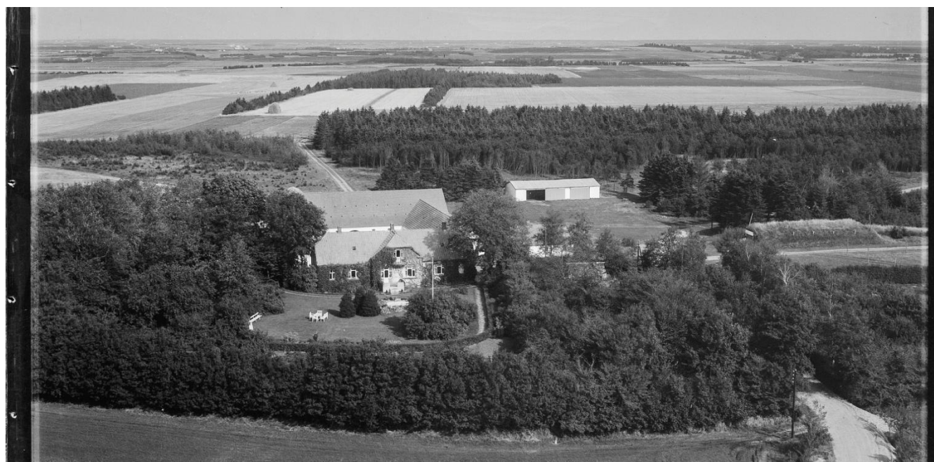
St. Gjedbo 1956