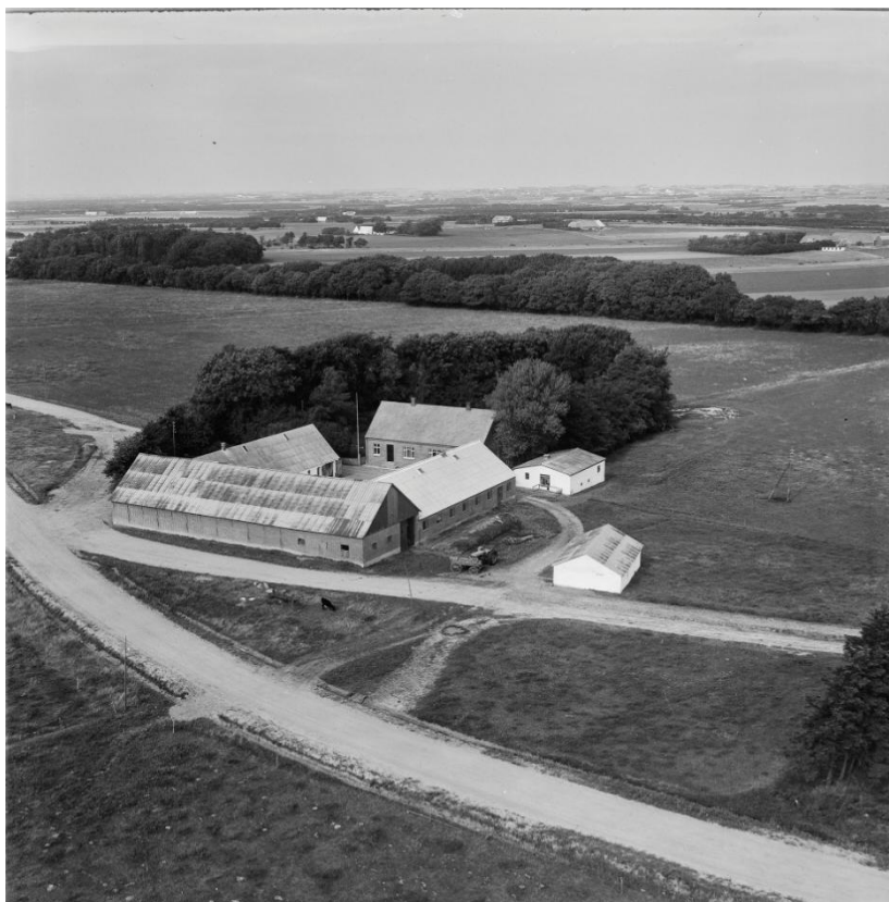
Vestergård ca. 1955