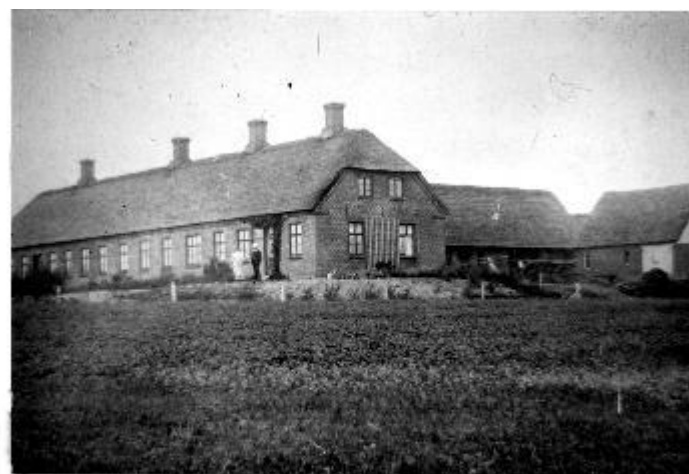
Hovedskolen Nr. Orme