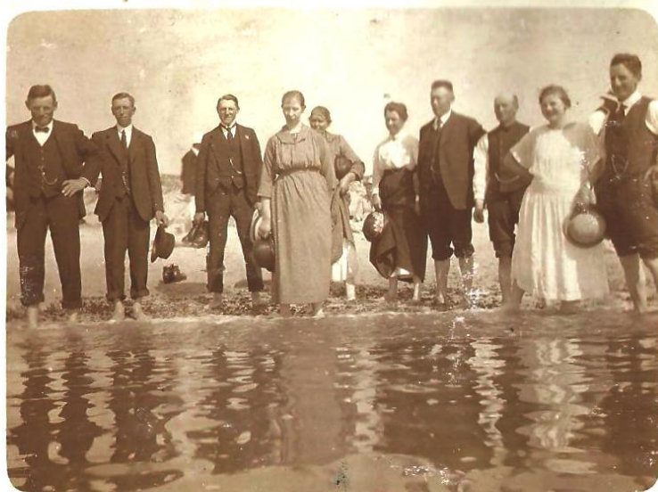
Udflugt til stranden.

Hattene er taget af til ære for fotografen.