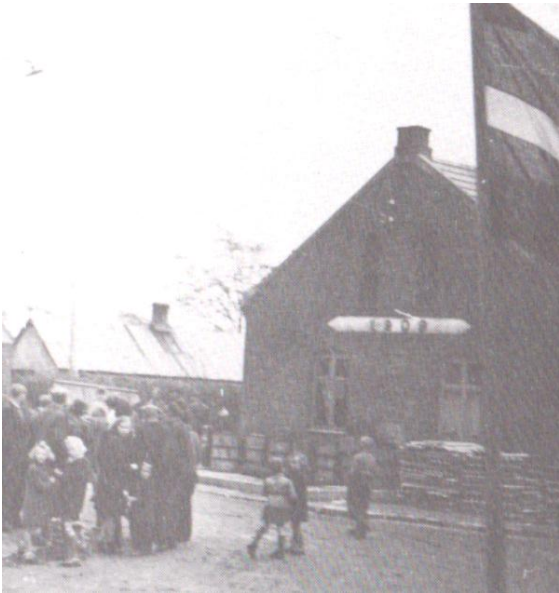
Samlingshuset 5.maj 1945