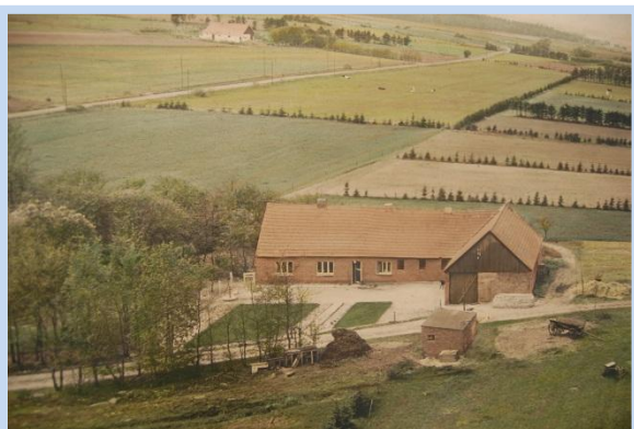
»DALHUS« anno 1952

I 1959 fik mine forældre også bygget nyt stuehus, som jeg sammen med min far mere eller mindre selv var medbygger af. Materiale er for træets vedkommende var genbrugstømmer fra ombygningen af Holstebro Sygehus. Stuehuset i "DALHUS", som ses nedenfor, blev omdannet til kostald og værksted.