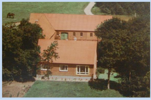
»DALBO« anno 1959.

Med det nye stuehus valgte mine forældre at kalde stedet "DALBO", de syntes de lød bedre end DALHUS.