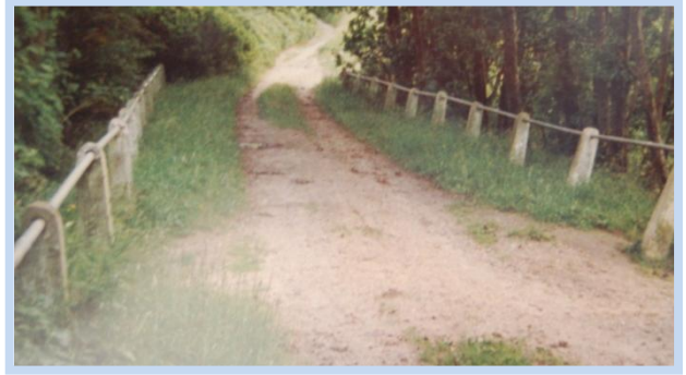
Den gamle bro fra 40'erne, førte op til gården fra Uhresø.