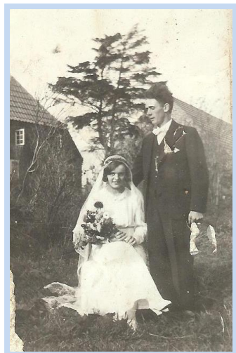
Mine forældre her som nygifte i 1934 med deres gård i baggrunden.