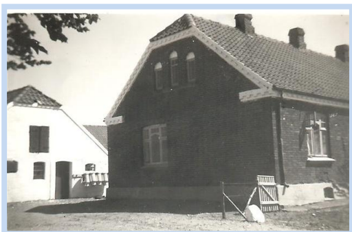
V. Halgård. Vinduet foran var mit værelse.