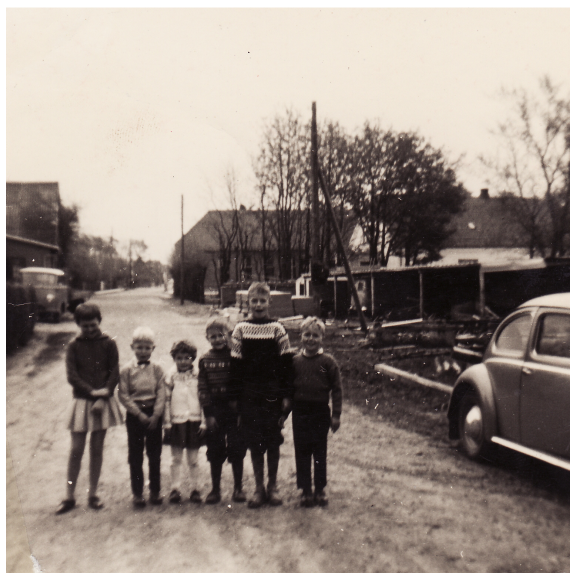
Min barndomsgade i Tvis

Omkring 1954 / 1955, jeg er lidt usikker på årstallet, men da var der kongeligt besøg i Tvis. Den nybyggede sognegård skulle officiel indvies. Jeg husker at vi børn havde fri fra skole, og var linet