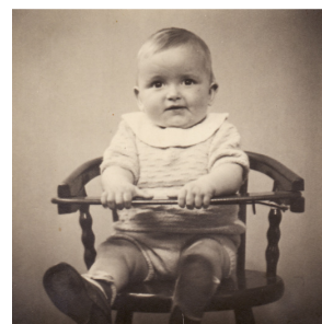
Mig som baby

Samtidig med at mine bedsteforældre flyttede, købte mine forældre huset af mine bedsteforældre.