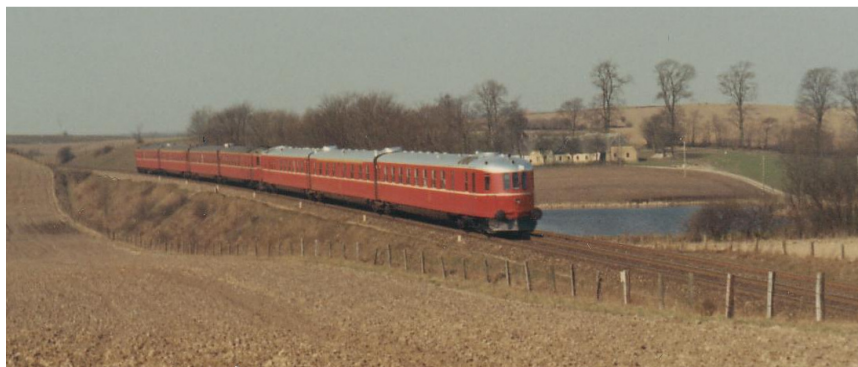
Lyntog anno 1955

tit skulle der rangeres godsvogne fra og til toget. Kartoffelcentralen Sajyka sendte i højsæsonen daglig fuldt lastede godsvogne af sted. Brugsen og Fodderstoffene fik også forsyningen med banen, og i november var det juletræer der blev lastet til Tyskland. Alt dette fulgte jeg intens på nærmeste hold. Tvis Station havde et hovedspor, et vigespor og et ladespor. Ladesporet var det yderste spor der løb næsten i fuld længde mellem bommene ved Hovedgaden, hen forbi Sajyka og til bommene