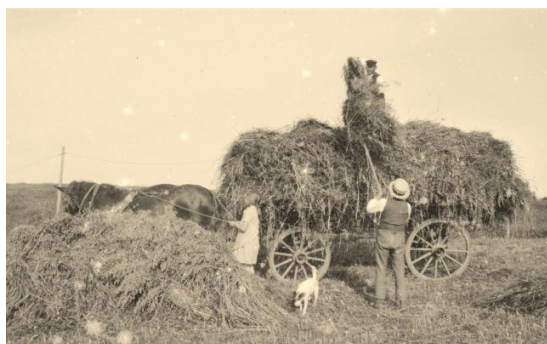
Kornet køres i lade

Det var på den tid, jeg af og til tog turen omkring kirkegården i Holstebro, før jeg mødte på gården. Somme tider brugte jeg en undskyldning om, at jeg havde haft eftersidning i skolen. Om nogen kontrollerede dette ved jeg ikke, men jeg hørte aldrig noget for det.