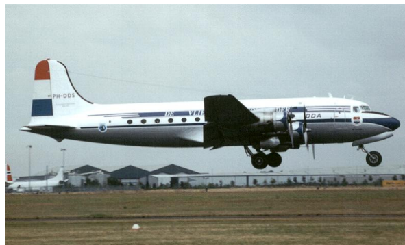
En fransk DC4 lander i Københavns Lufthavn