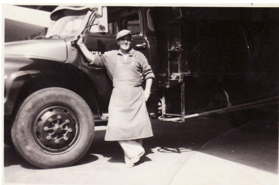
Far med sin elskede Bedford

Når vi hentede gødning eller foderstoffer, kørte vi det som regel direkte ud til landmændene, og efterhånden er jeg blevet så stor at jeg kan sætte sækkene til kanten af ladet, hvor far så kan tage dem på ryggen og bære dem ind under tag hos