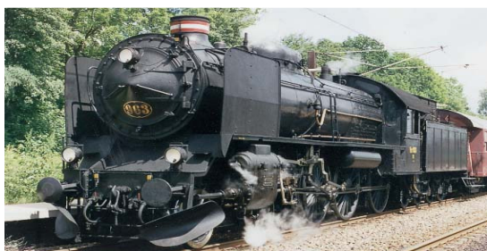
Damplokomotiv Litra R. Topfart 100 km./t.

Turen hjem gik også med toget. Først kørte vi med et bumletog til Korsør. Så med færgen til