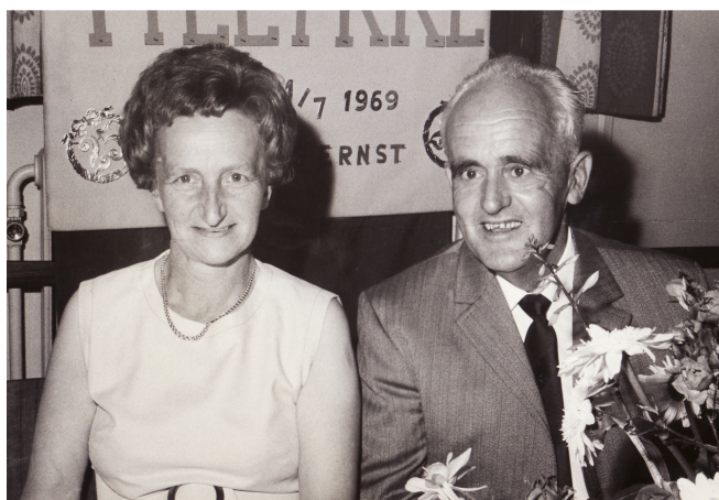
Mor og Far ved deres sølvbryllup i 1969

Landevejen er den vi i dag kender som Glyngørevej der løber fra Skive og mod Glyngøre i Nordsalling. Jernbanen, der er nedlagt for mange år siden, men løb også fra Skive og til Glyngøre. Det lokale stednavn er Dølbyvad i Øster Dølby.