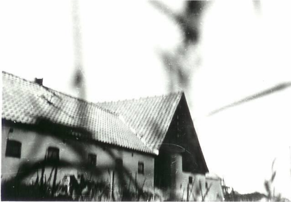
Udhuse mod øst