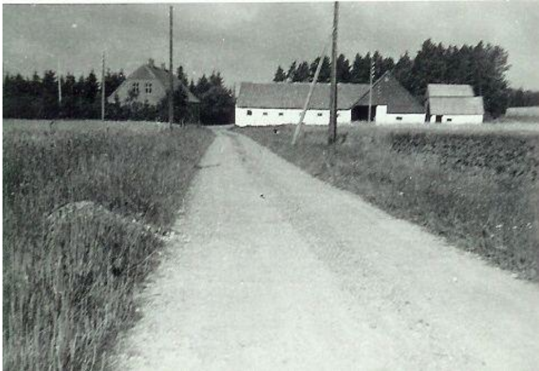
"Lille Uhlund" - fra øst - omkring 1950 med vejføring igennem gård