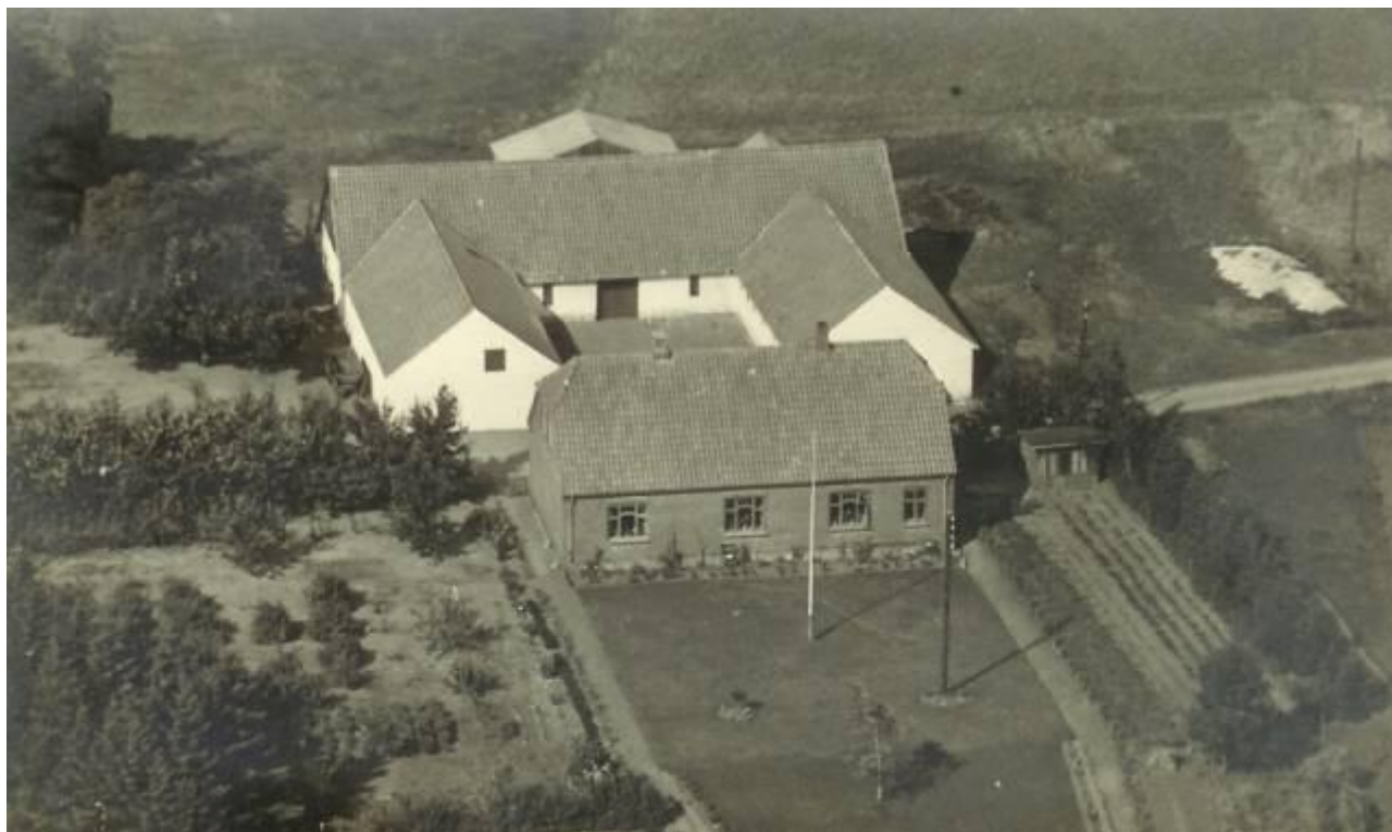
"Lille Uhlund" - Huse og haveoversigt - omkring 1950 med gl. vejføring