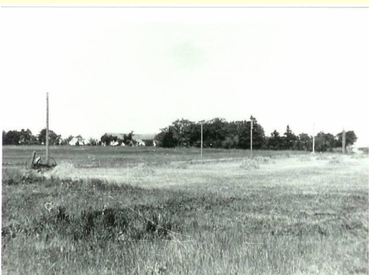
Udsigt over marken mod nordøst - naboejendom "Vesterlund"