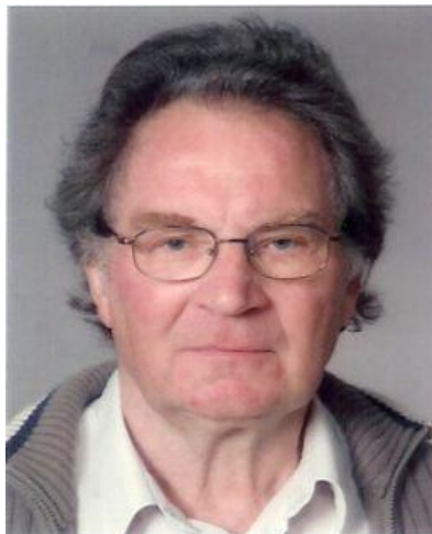
Fortalt af: Christian Østergaard Jensen.