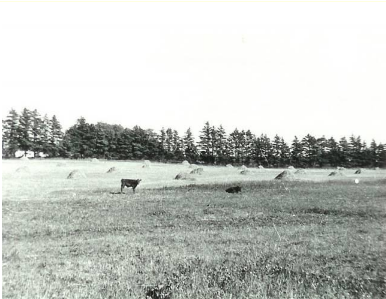
Høstakke på marken mod sydøst - naboejendom "Skadborg" skimtes tv.