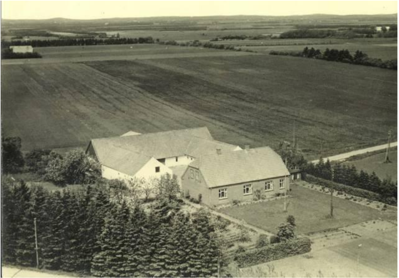
"Lille Uhlund" - udsigt mod nordøst - omkring 1950 med gl. vejføring