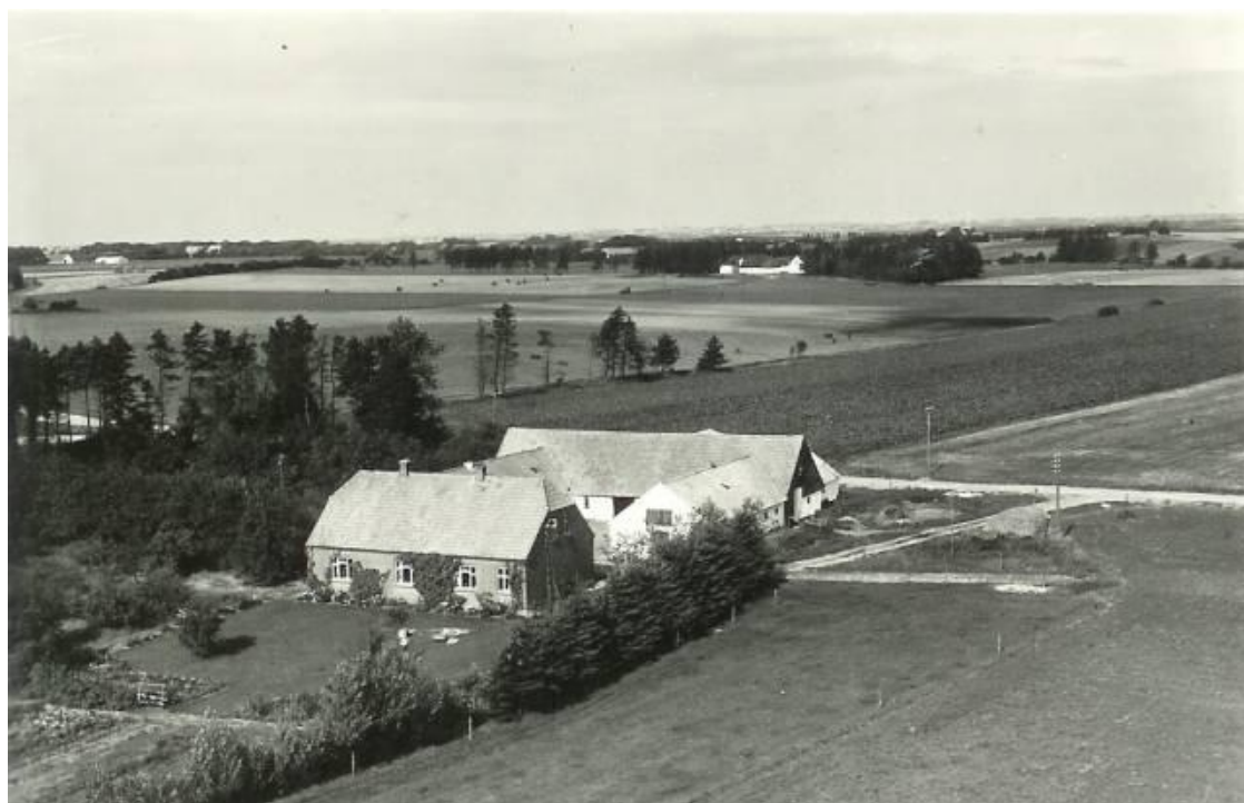
"Lille Uhlund" - udsigt mod nordvest - omkring 1954 med ny vejføring