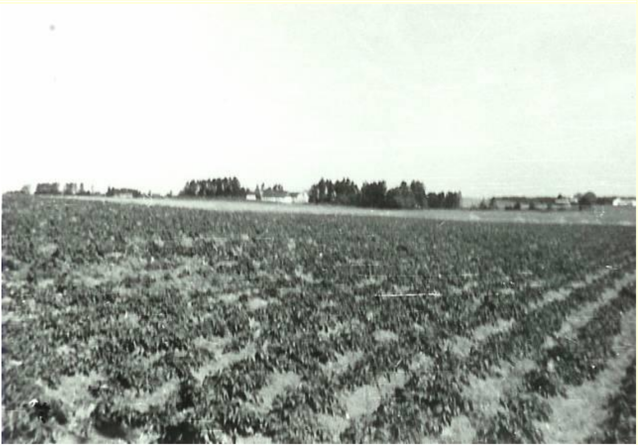
Kartoffelrækker i nordmark - naboejendom "Sønderlund" til venstre