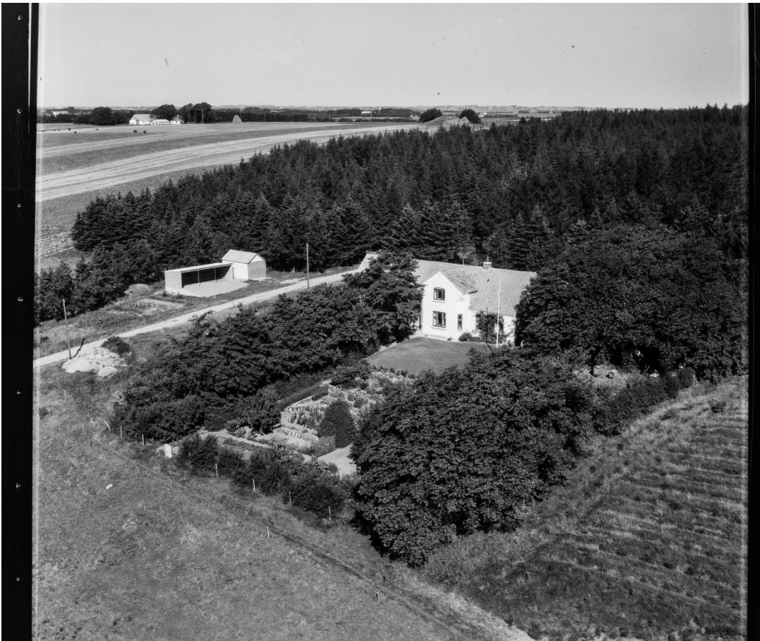
Skautrup Skole 1958