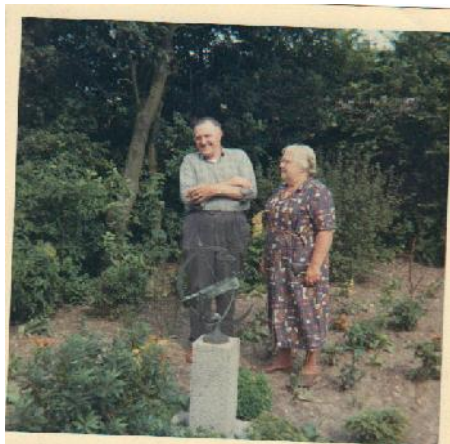
Min mor og far i haven i Kabbels, godt nok nogle år senere, jeg vil mene, det er omkring 1970.