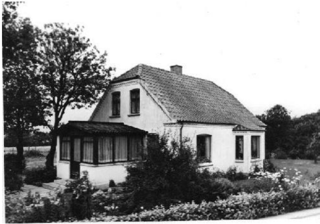
Kabbels, som den så ud efter renoveringen.