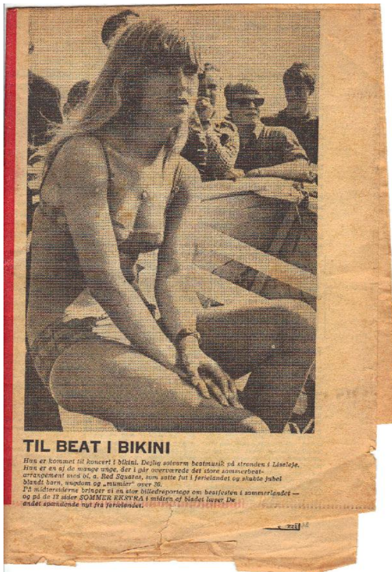
Det er mig med de mørke brilleglas.