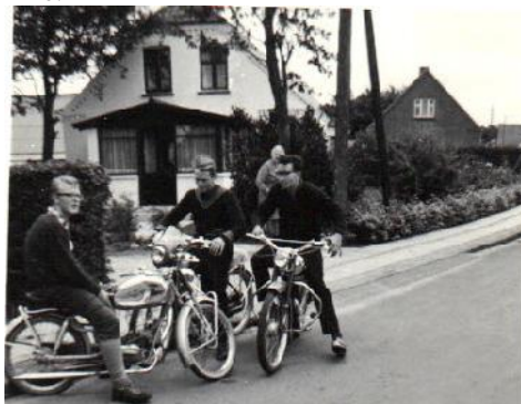
Her med vore elskede knallerter. Min mor anes i baggrunden. Bedømt efter højden på hækken vil jeg