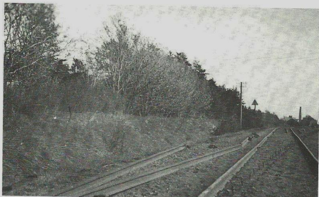
Jernbanen blev ofte udsat for sabotage. Her er det skinnerne ved Tvis station, det er gået ud over. Den høje skorsten i baggrunden er formentlig mejeriskorstenen i Hovedgaden.

vemaskiner fra Karup på øvelse. En gang var der en af dem, der forulykkede. Vi var hjemme for at få vor eftermiddagskaffe og var lige kommet op i roerne igen, da vi så nogle mindre fly højt oppe, der lå og lavede loop. Pludselig var der en af dem, der larmede voldsomt og vendte næsen nedad. Vi hørte braget, da den med fuld tryk ramte jorden og så røgen stige op ovre i Aulum. Om aftenen var vi derovre for at se. Den var styrtet ned i kanten af en eng ved Lergrav. Der stod en enkel tysk vagtpost, men vi kunne gå rundt og kigge på vraget lige så meget vi ville.