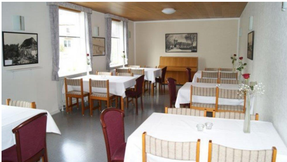
Hyggestuen – bruges også til mindre selskaber.

I Tvis Sognegård er der to sale (store og lille, kaldes også teatersalen og møllestuen) og to stuer (hyggestuen og pensionatstuen) til udlejning.