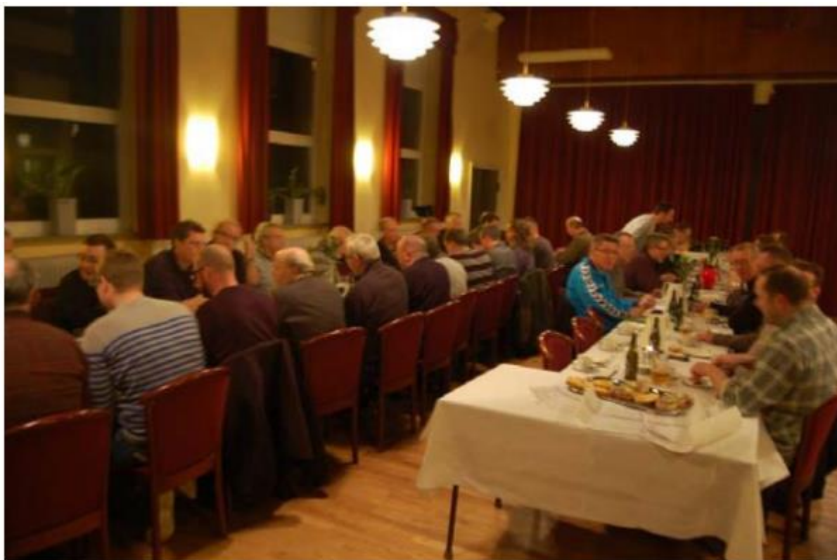
Billede fra typisk generalforsamling i Tvis Sognegård her i januar 2012.

Her er det jagtforeningens årlige generalforsamling. Jagtforeningen har altid brugt Sognegården til generalforsamling.