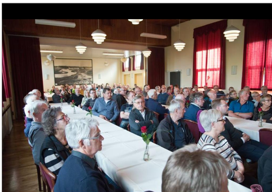
Maj 2015 - informationsmøde i Sognegården om motorvejen.