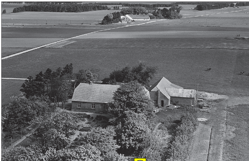
Husmandsstedet »Frydenlund«, der fra 1915 til 1919 var Tvis Asyl. Billedet er fra 1950-erne.

den 27' f.M. har meddelt Tilladelse til, at den gamle Skolebygning i Tvislund ombygges til Benyttelse til Fattigasyl, meddeles herved Godkendelse af den hermed tilbagefølgende Plan dog saaledes, at de i den hoslagte Afskrift af Ringkjøbing Fysikats Skrivelse af 25' Februar d.A. foreslaaede og af Sogneraadet tiltraadte Ændringer foretages og at den at Amtslægen krævede Ventilation tilføjes. De tvende Værelser paa henholdsvis 165 o' og 112 o' med Vinduer i Nord vil kun kunne benyttes til Spisestue og Opholdsrum. Asylet vil højste kunne beboes af 6 Personer, Børn indbefattede. Naar Omdannelsen har fundet Sted, imødeses underretning herom for