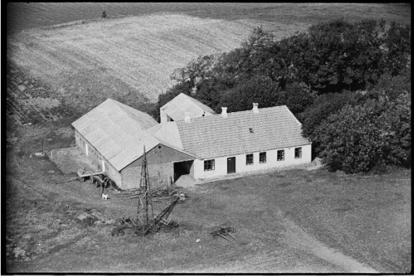
Amalielyst 1950. Her var Tvis Hovedskole fra 1833 – 1887.