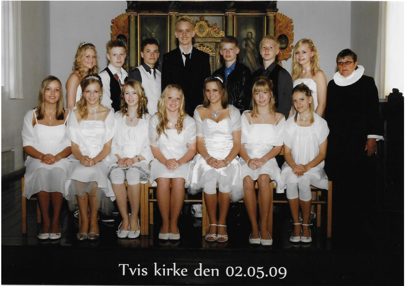
Tvis kirke den 02.05.09