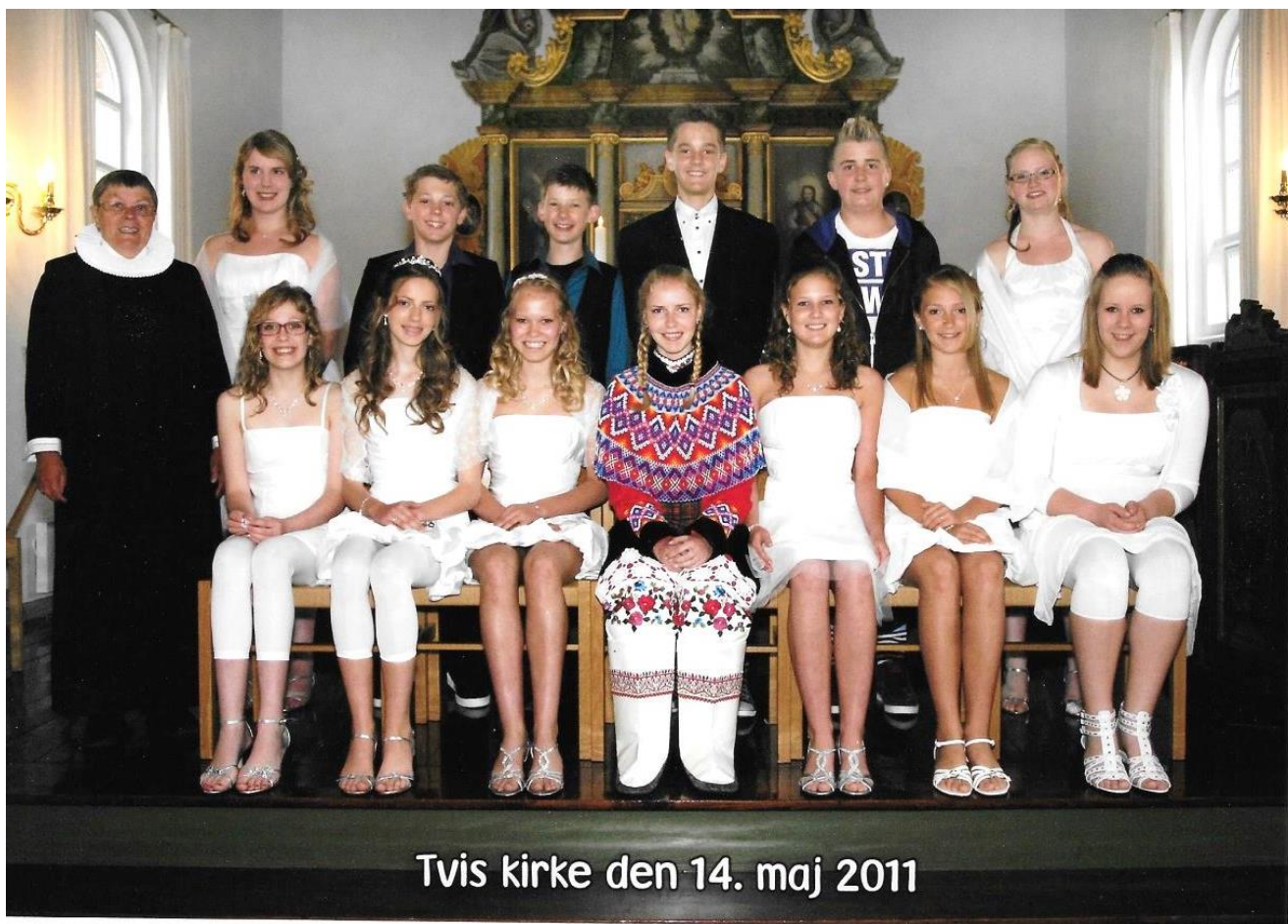
Tvis kirke den 14. maj 2011