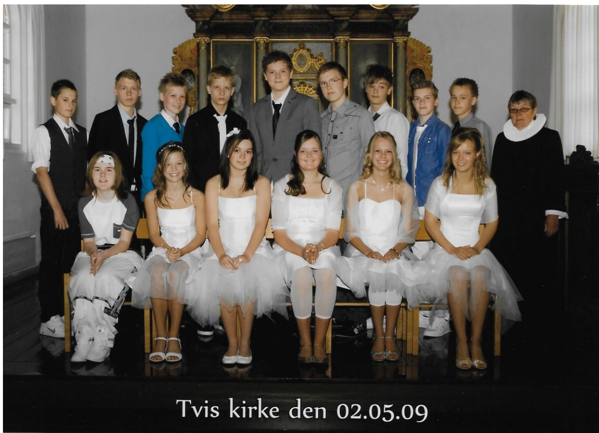
Tvis kirke den 02.05.09