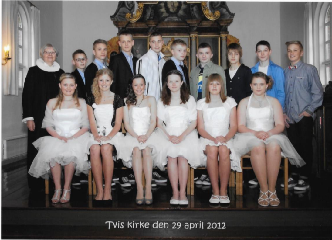
Tvis kirke den 29 april 2012