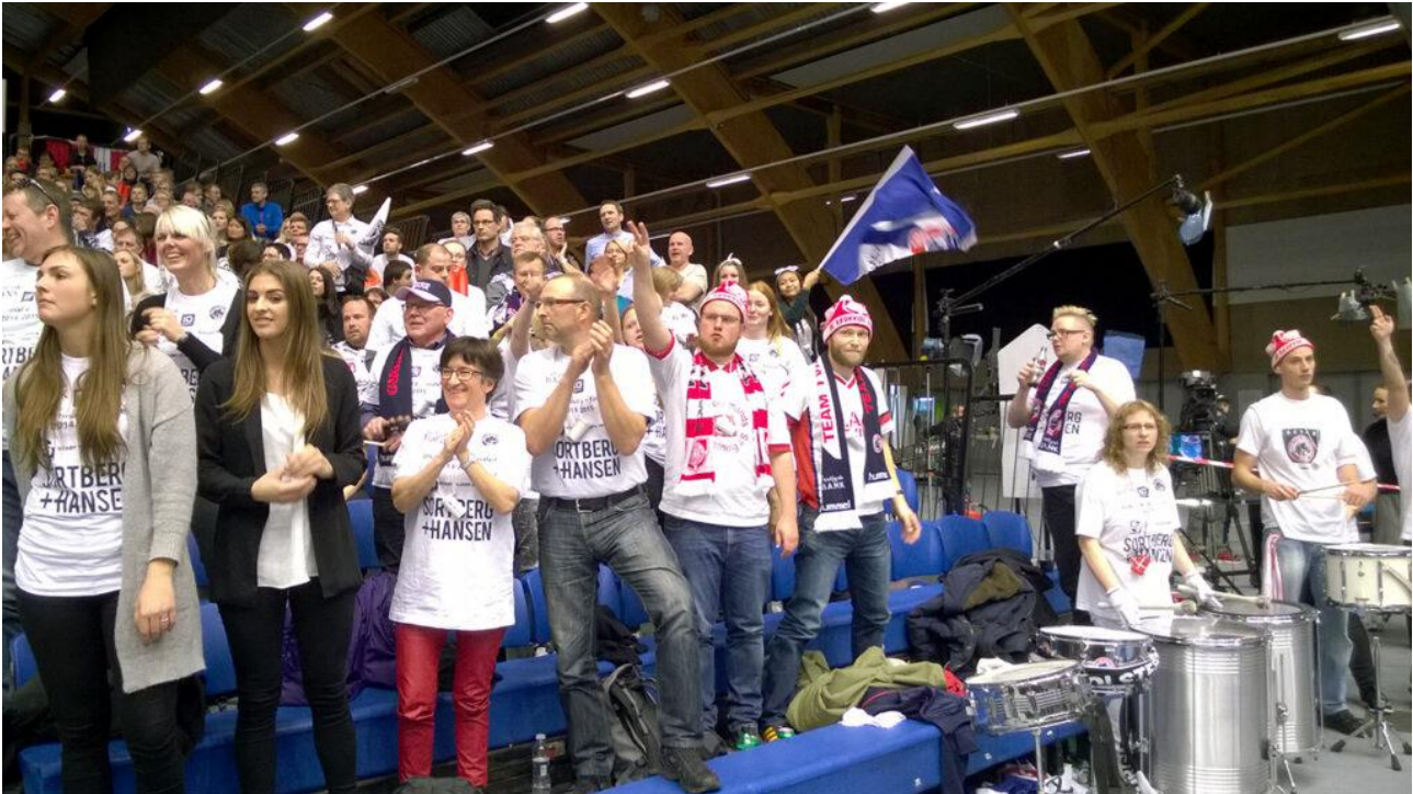
Opbakningen til Team Tvis Holstebro fejlede ikke noget ved Final 4 i Gigantium i Aalborg 28. og 29. marts 2015. Det var dog ikke nok til at vinde pokalfinalen mod lokalrivalerne fra Skjern.