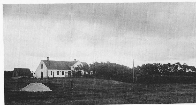
Skavtrup skole 1913.

To dage i ugen var der altså skole i Skavtrup, i et lejet lokale i en af de tre Skavstrupgårde, ifølge Trine Sønderhus var det i Over Skavtrup, hvor hun havde gået i skole sammen med